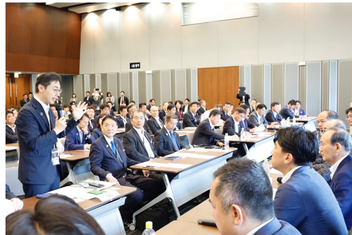
左,上：令和6年度総会の様子（参議院議員会館）