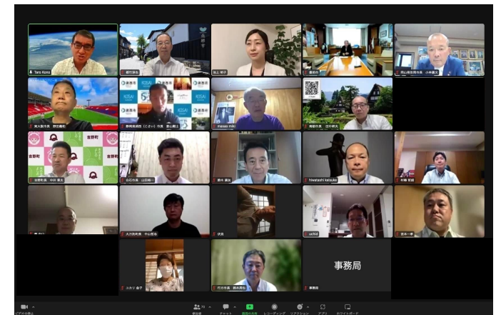
毎月様々なテーマの下で行う意見交換会の様子（Zoom）