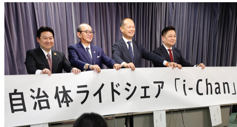
「i-Chan」先行自治体記者発表の様子（令和6年2月22日） 左から:大分県別府市（6月）、富山県南砺市（4月）、右:石川県小松市（2月） ※（ ）内は開始月。いずれも令和6年

◀「i-Chan」ロゴマーク（認証マーク） 愛称は公募で決定。募集作品の中で最も多かった「愛」「私」という意味を連想させる「i」に加えて、高齢者や子どもたちも呼びやすく、「ちゃん、さん」が持つ親しみやすさを外国人観光客にも感じてもらう効果をもつ。