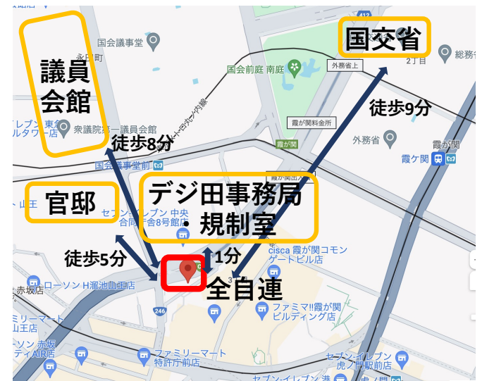
(参考) 「全自連」事務所が入居するビル・所在地