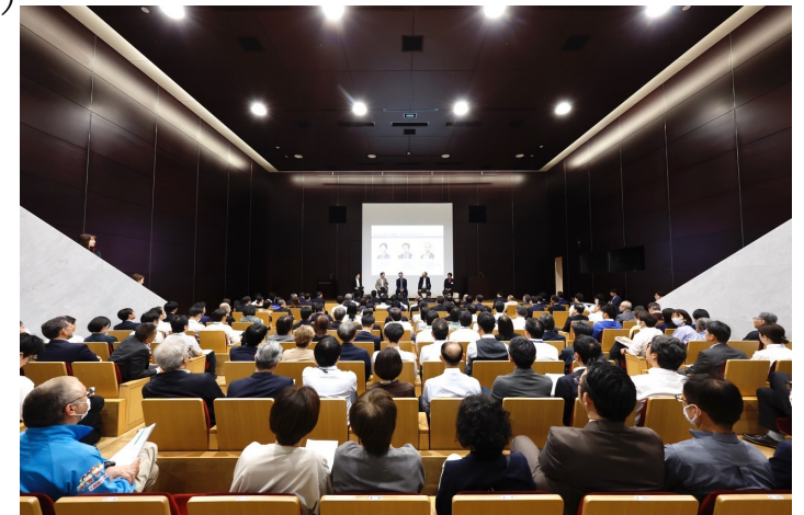
地域住民・ステイクホルダーと共に行う特別講演の様子（全国各地で対面開催）

問合せ先 localgov01@gmail.com （代表） 事務所 東京都千代田区霞ヶ関3丁目6番14号504